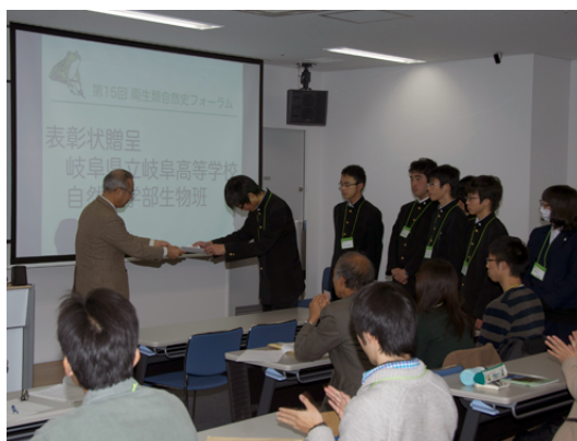
岐阜高校自然科学部生物班 表彰式